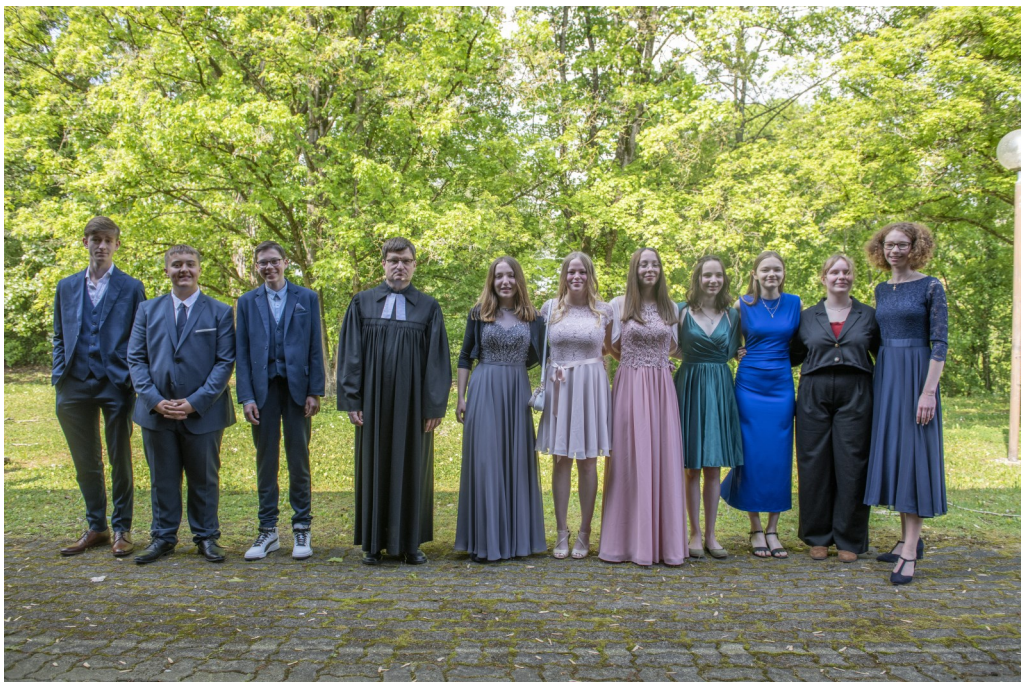
Bild: Die Konfirmandinnen und Konfirmanden 2022.